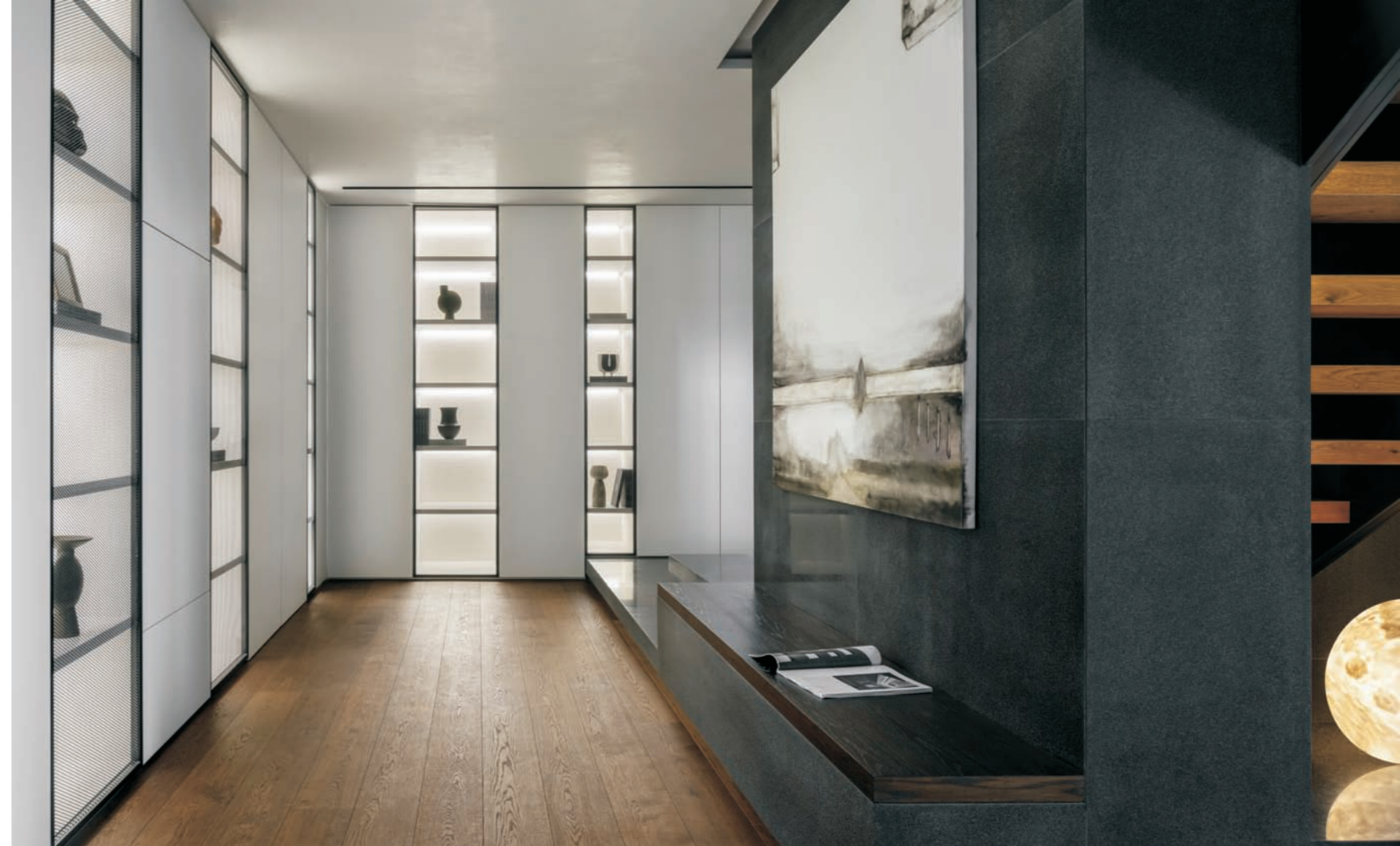
左图 通透的室内外布局将自然引入室内 右图 楼道区域周边的空间区域

豪宅之所以“豪”，非但在于“大”，丰富的细节亦理应值得考究。主卧在点线面的排布中有着熟稔自如的转换，在黑白灰的围合中饱含深情。床头采用方磊惯用的三角构成手法，既打破对称式单调，又构成了入室的视觉落点。所选取的灯饰本身也渗透着设计师的精巧心思，与卧室浑然相融，增添一抹柔情的点睛之笔。