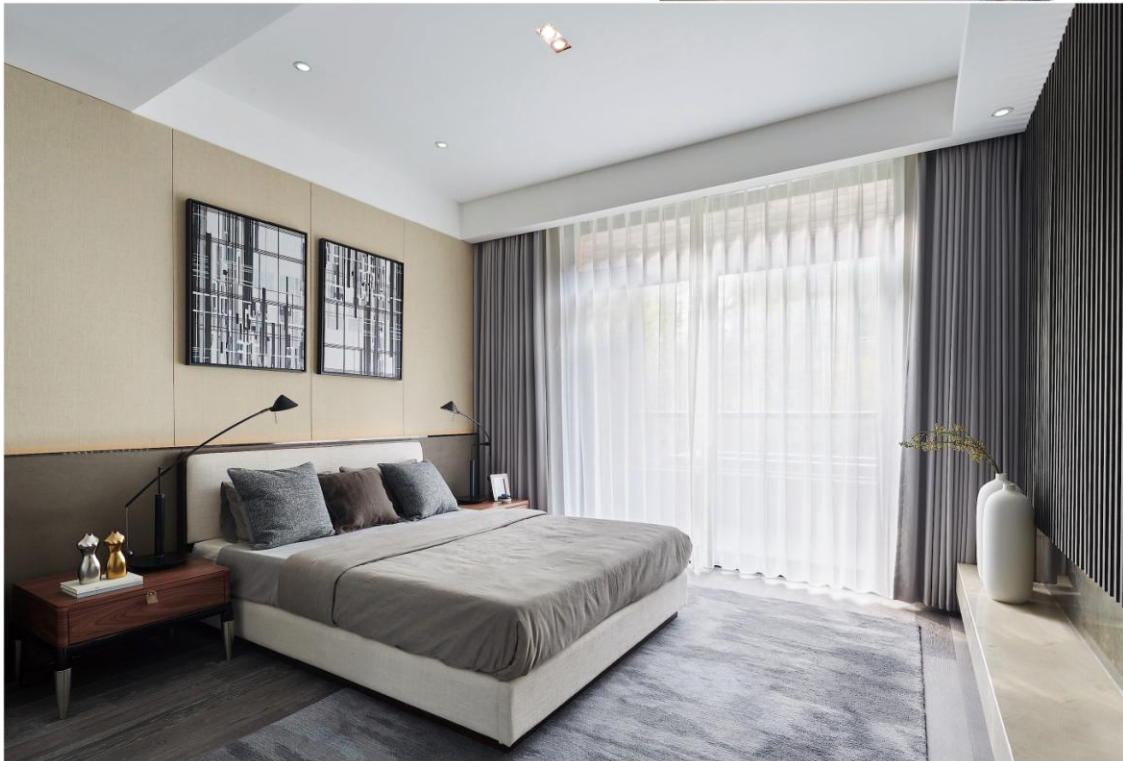
本页 / 1 水吧的圆形软饰地毯有效缓解空间的单调，同时又呼应蓝色家私。2 衣帽间，简明合理划分空间，兼具现代感和实用性。3 吧台由玄关处延伸而来，作为通道关系上的枢纽空间，联接客厅及餐厅，起到过渡与衔接作用。右页 / 上 浴缸位置抬高，视野开阔，沐浴其中亦可远观庭院景观。下 长形床头两幅黑白色氛围而成的挂画又和花艺形成互动，整体空间简洁却又不失质感与趣味。