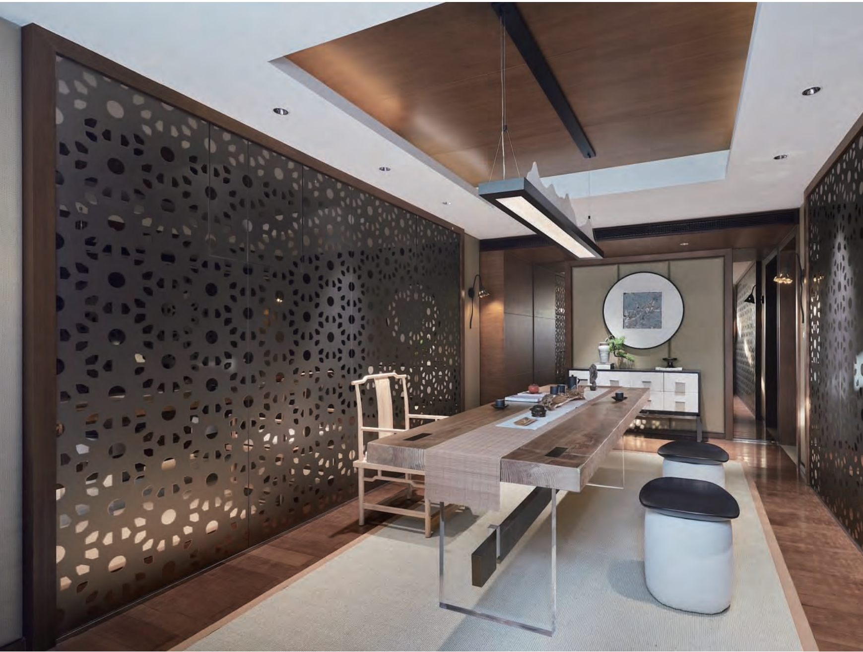
本页 / 依托简洁块面恰如其分地完成错落起伏交映的秩序，温馨、随性又不乏品质感。对页 / 烹茶会友，淡然品茗，将喧嚣繁华置之身外，让心境与时光慢下脚步。