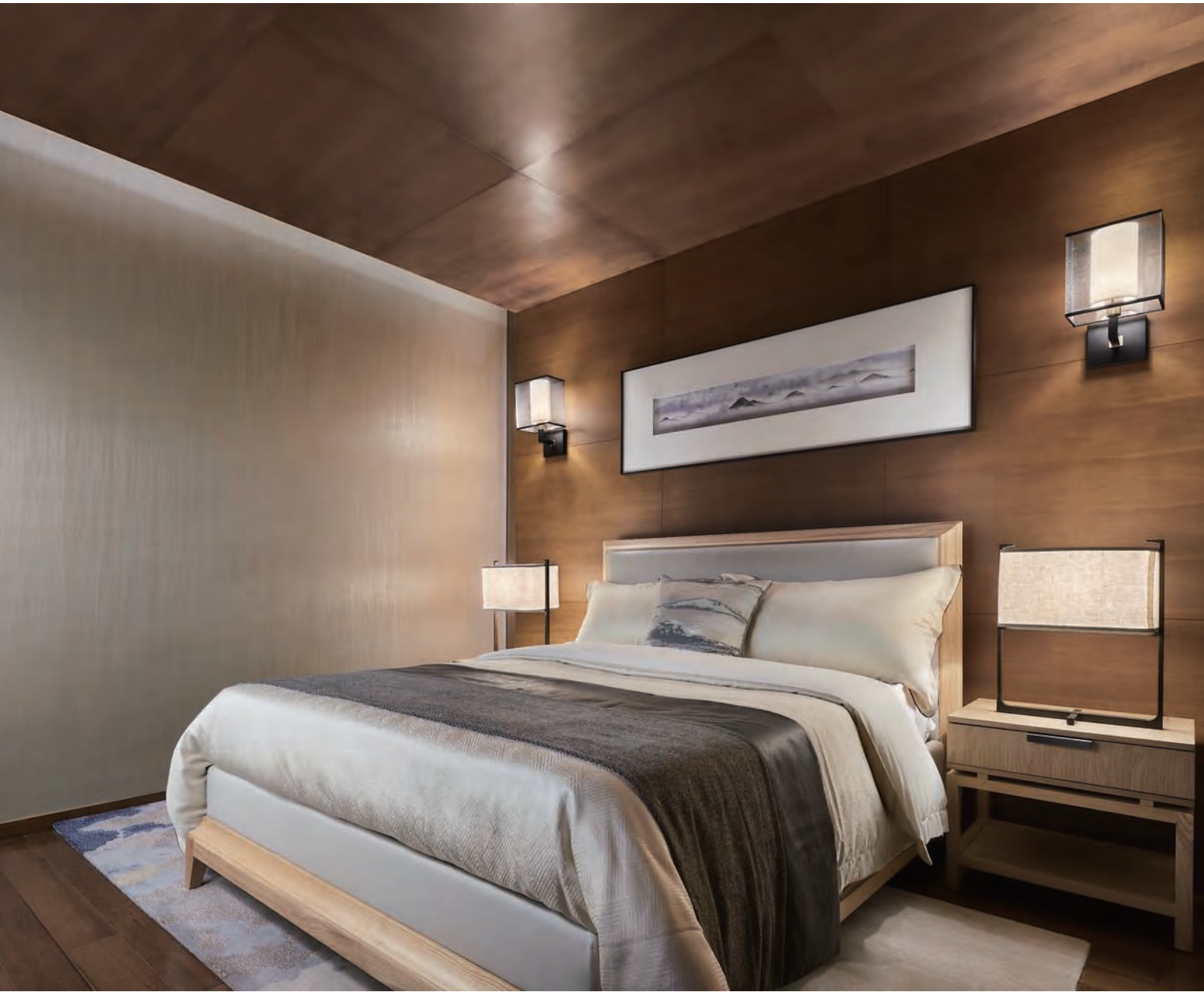
本页 / 沿袭中式对称之风，大方得体，在灯光渲染下，素雅又别具温情，彰显出沉稳雅致的待客之道。对页 / 素色壁纸搭配柔软家具，卧室温馨感倍增。